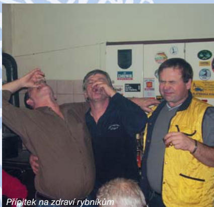
Přípitek na zdraví rybníkům